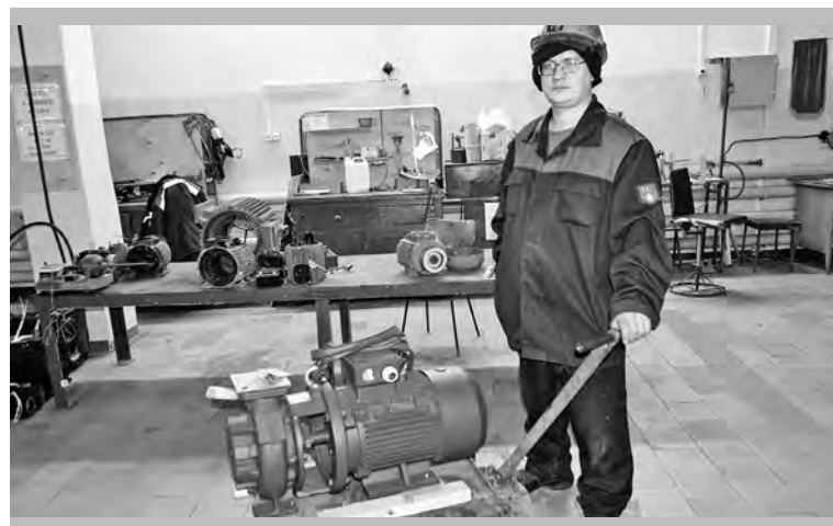
Этот резервный насос – самая свежая новинка участка подготовки производства и ремонта электрических машин

рядка 40 ламп освещения площадки и периметра завода, около 200 люминисцентных ламп на светодиодные на цеховых подстанциях и в здании