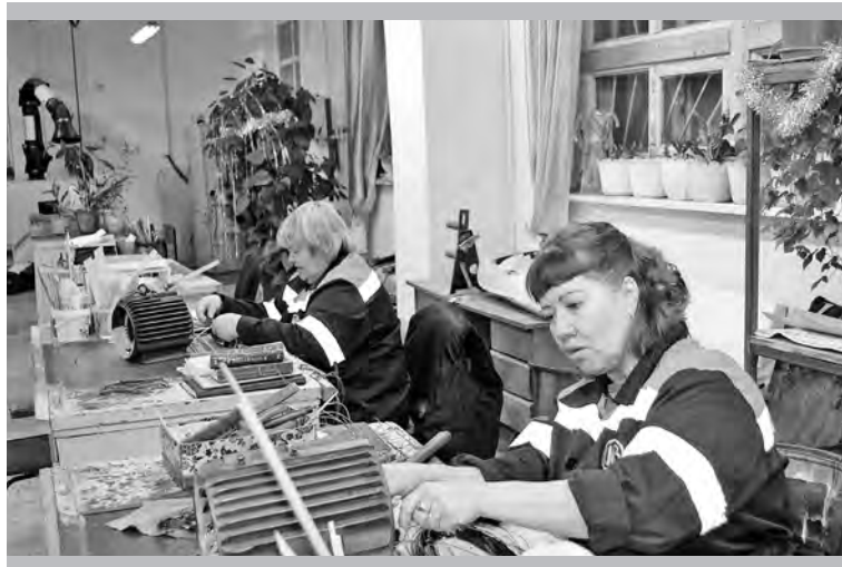
Через руки обмотчиков проходят все электродвигатели завода

Что касается зданий и сооружений, то я просто не припомню, чтобы когда-то ещё за один год был выполнен такой обширный объём работ по их ремонту и поддержанию в работоспособном состоянии! В частности, отремонтирована стена пропиточного отделения; заасфальтирована прицеховая территория в районе КПП, РП-1, ЦКС; про-