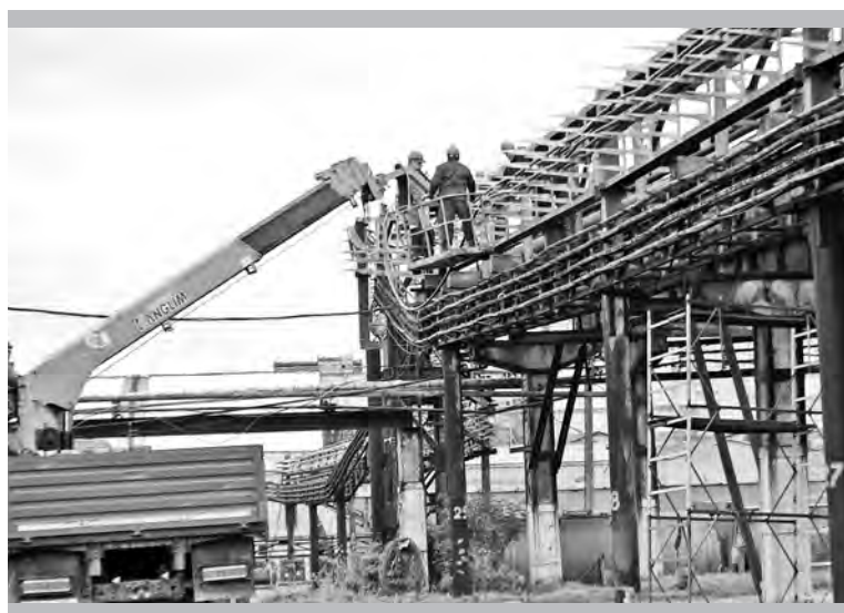
Работы по переносу кабеля из тоннеля на эстакаду

Считаю, что мы достойно отработали этот год и в плане ремонтов оборудова-